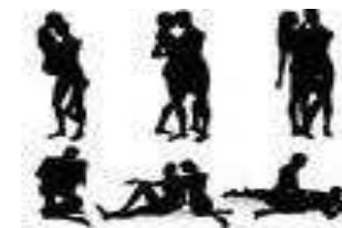
Amours ? Sexualités ?.... Dites vous ?

IABFS : Institut d'Analyse Bioénergétique France Sud